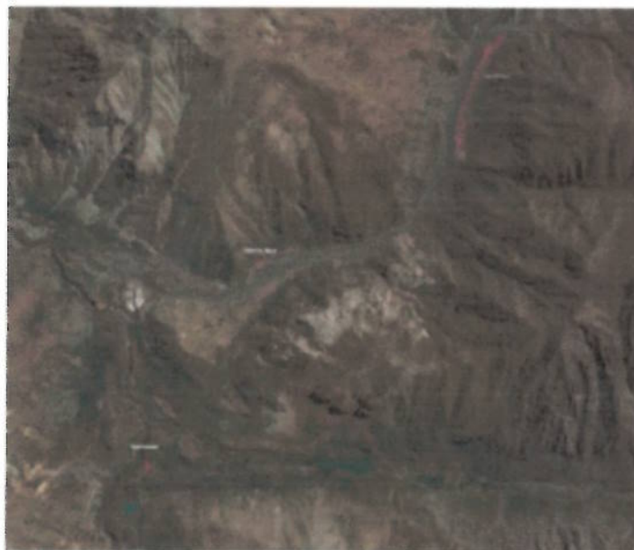
Imagen 2: Imagen google de sectores a mantener en el Área de Los Piches, Salto de agua y Queltehue:

Para los distintos sectores se cotizará el servicio de mantención que contemplan en términos generales, las siguientes acciones: