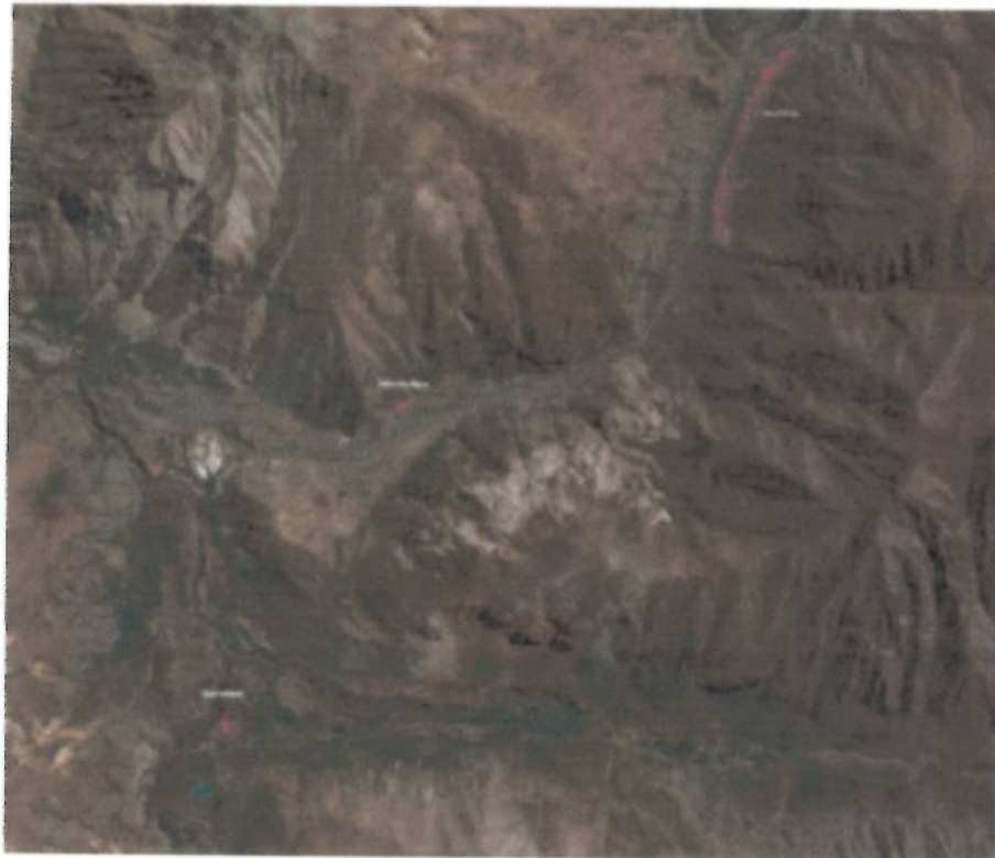
Imagen 2: Imagen google de sectores a mantener en el Área de Los Piches, Salto de agua y Queltehues