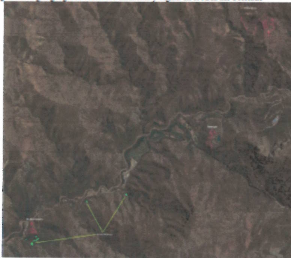
Imagen 1: Imagen google de sectores a mantener y vigilar en el Área del Colorado